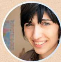
Sarah SERMONDADAZ The Conversation France