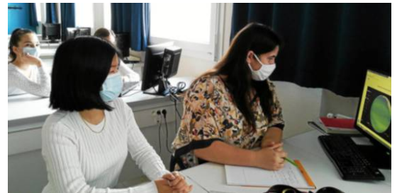
Les élèves ont apprécié la journée de sensibilisation au changement climatique.